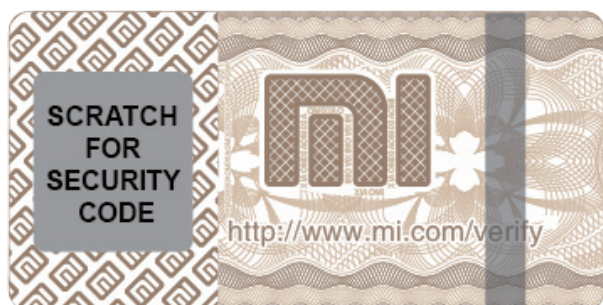
Наклейка для защиты от подделок

Каждый Внешний аккумулятор Mi Power Bank поставляется с наклейкой для защиты от подделок на наружной упаковке. Сотрите покрытие и посетите сайт http://www.mi.com/verify/ , чтобы проверить подлинность изделия.