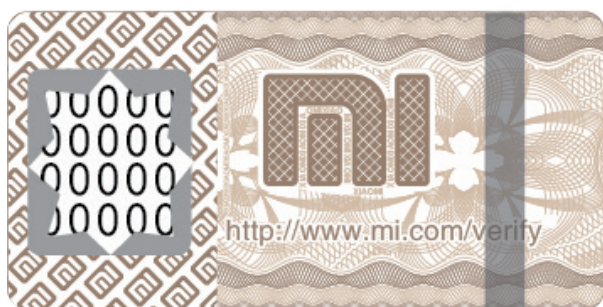
Стертая наклейка для защиты от подделок